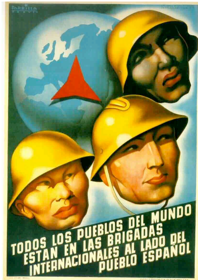
Parrilla .Cartel de las Brigadas Internacionales.GCE

La fotografía número 6, Hermanos Mayo “Obús caído en la calle de Alcalá de Madrid, se ofrece en una de las versiones que circulan, recortada.