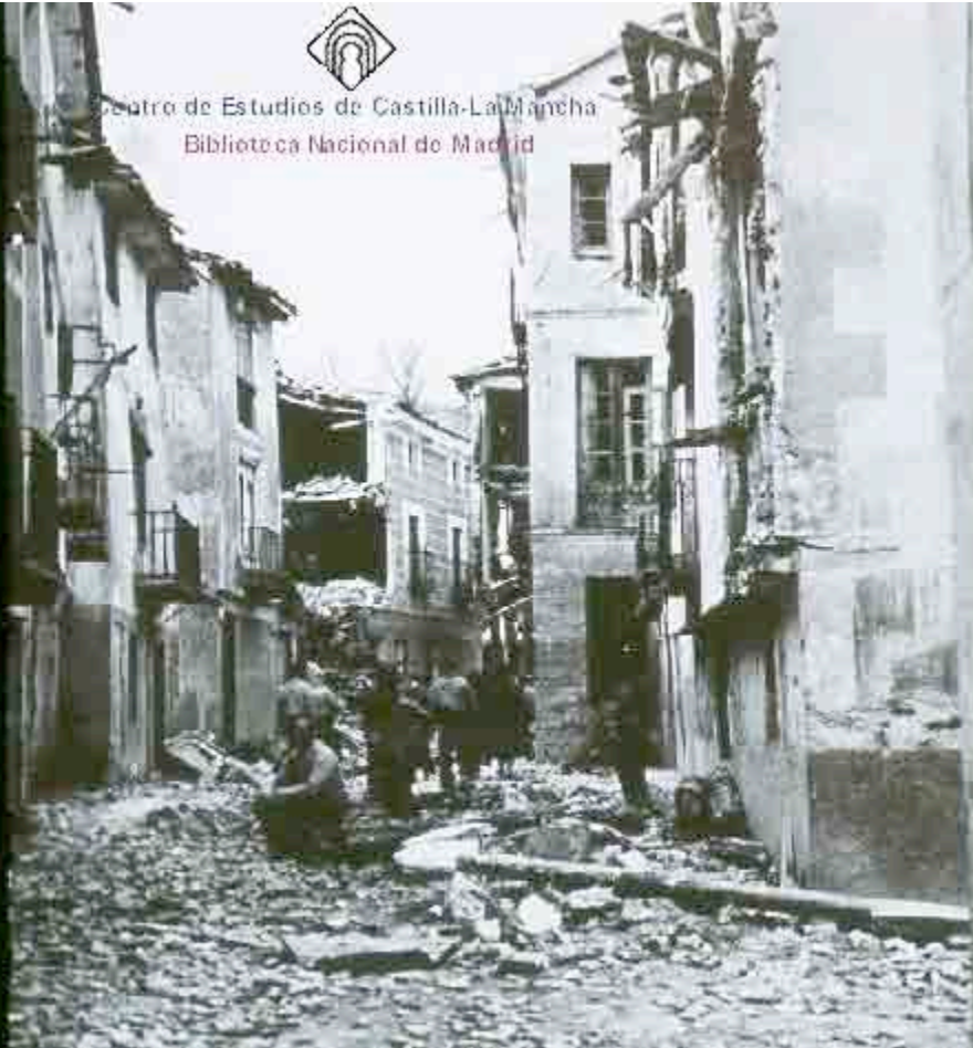
Fotografía número 7-Brihuega. Destrucción del pueblo. Autor anónimo. Fondo de Estudios de Castilla la Mancha.

Centro de Estudios de Castilla-La Mancha Biblioteca Nacional de Madrid