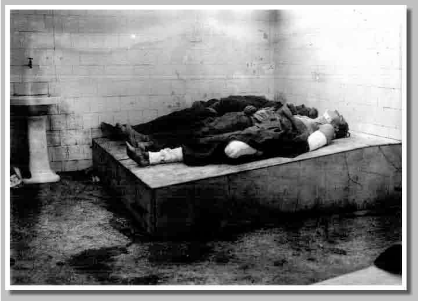
Fotografía número 8-Depósito de cadáveres.