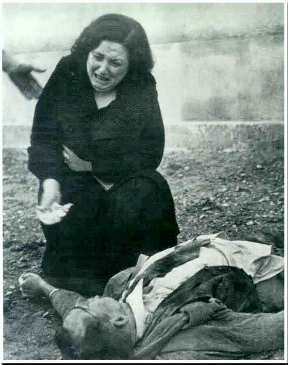
Fotografía número 5- Centelles. Cementerio de Lérida.3 de Noviembre de 1937.Fondo Centelles