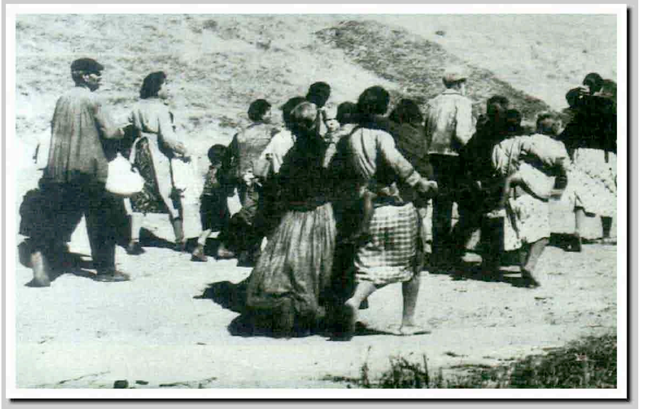
Fotografía número 10-Huida a Málaga.Probablemente de David Seymour.