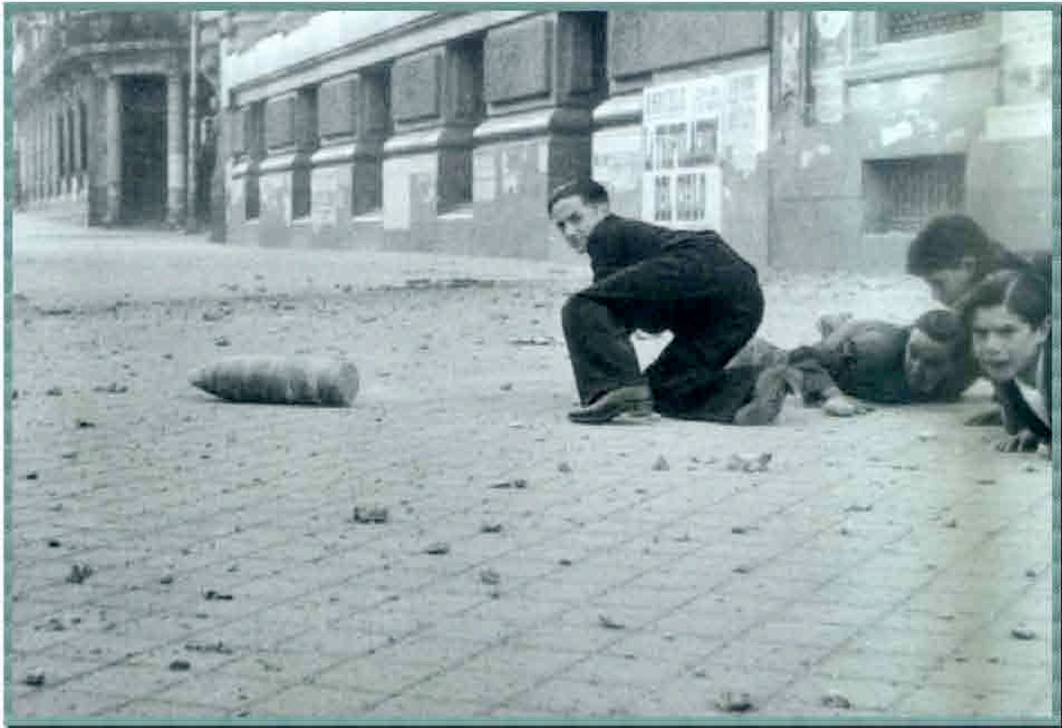
Fotografía número 6-Hermanos Mayo: Obús caído en la calle de Alcalá de Madrid. www.sbhnac.es