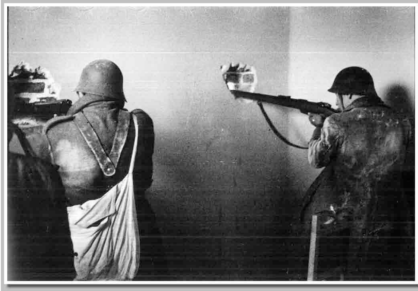
Fotografía número 9-Robert Capa. Soldados disparando a través de un muro en la Ciudad Universitaria. www.sbhnac.es