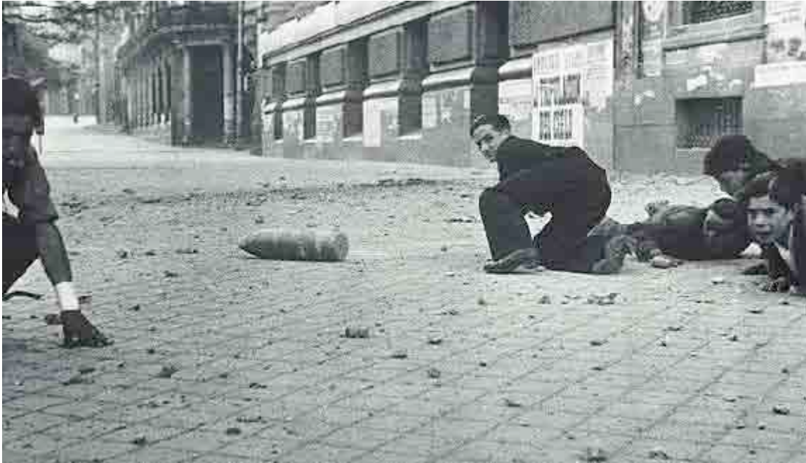
Hermanos Mayo. Obús que cayó en la calle de Alcalá. En www.sbhnac.es

Ese detalle no es anecdótico, sino realmente importante para estudiar el valor documental de una fotografía y las posibilidades propagandísticas de la misma. Si no tenemos en cuenta lo que sabemos, de la existencia de otro individuo en la escena, bien podríamos entender como deseaba transmitirse que la inseguridad ciudadana en el transcurso de la guerra resultaba mayor para la infancia, o dicho de otro modo, que la infancia era masacrada en el transcurso de los bombardeos.