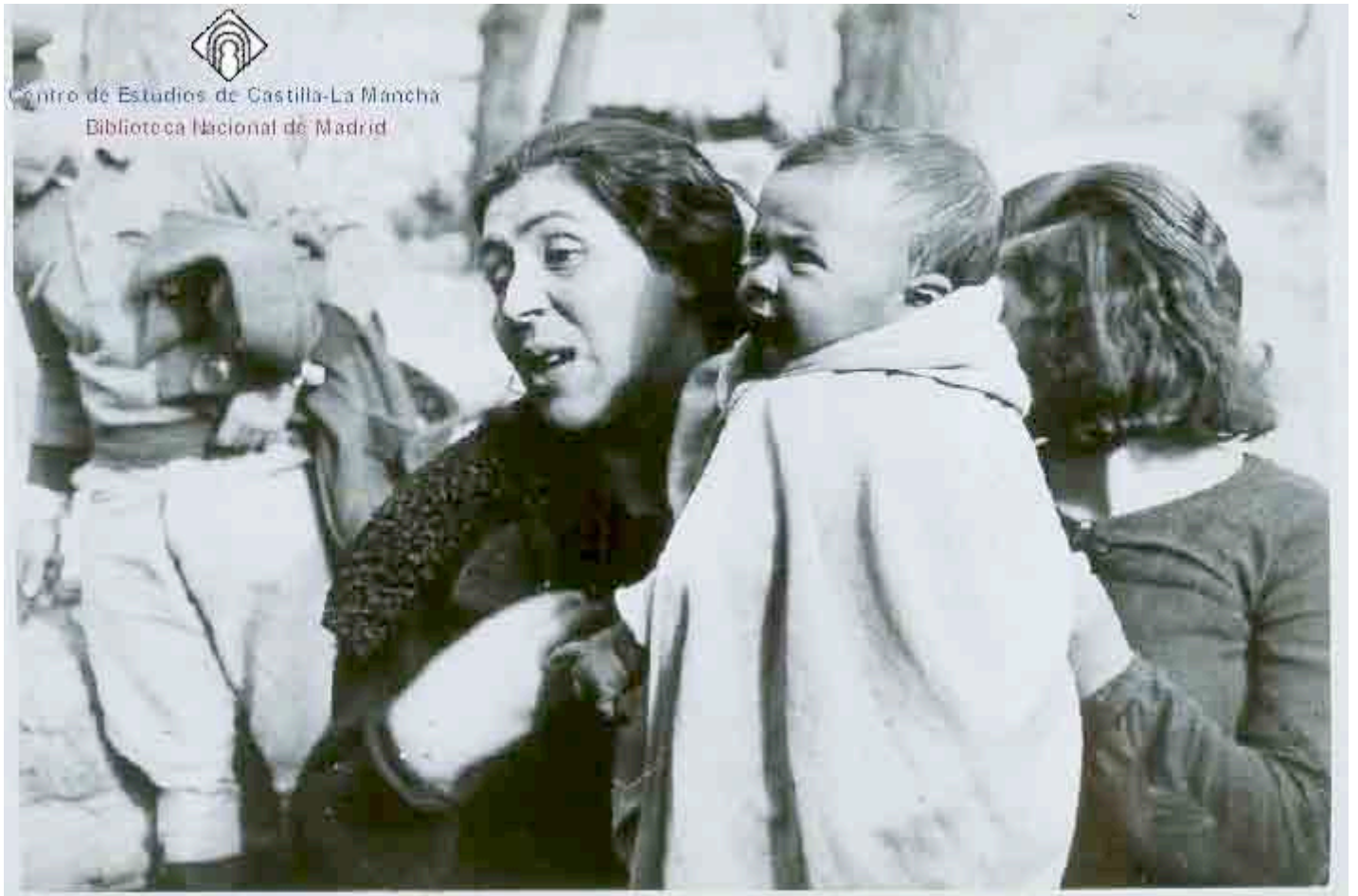
Fotografía número 1-Autor desconocido :Brihuega. Fondo fotográfico del Centro de Estudios de Castilla la Mancha.